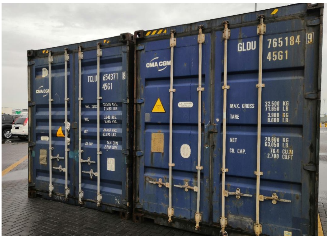
Kontena-kontena yang tiba dari Amerika Syarikat