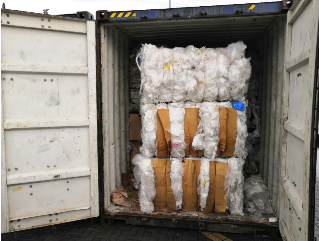
Kontena berisi sisa plastik HS3915 iaitu sisa plastik jenis Polyethylene