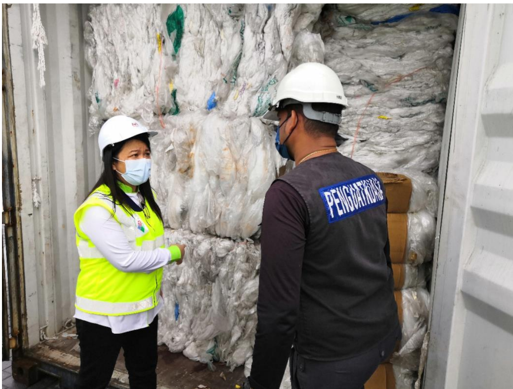
Pegawai JAS dan SWCorp sedang memeriksa isi kandungan kontena