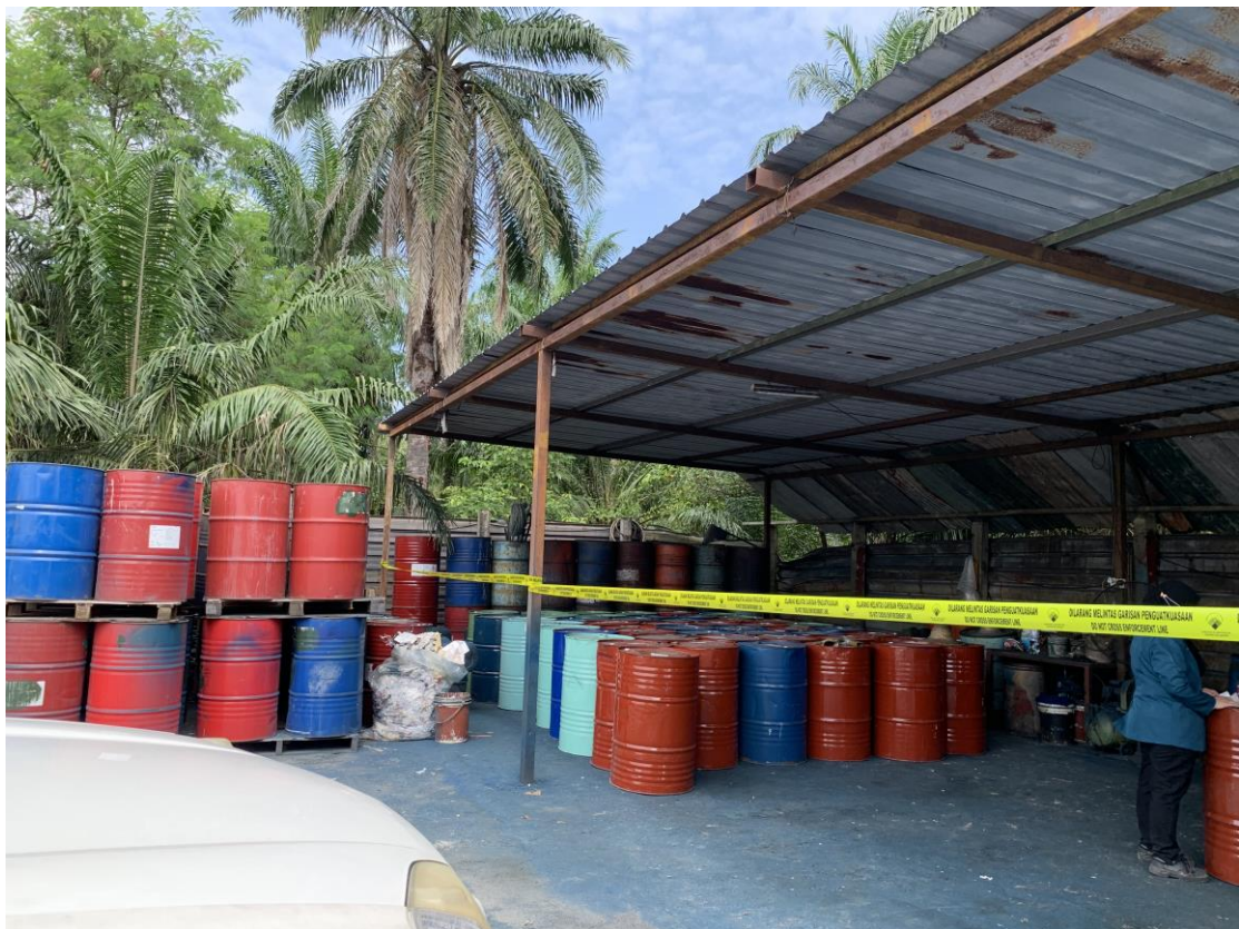
Kawasan penstoran tong-tong terpakai telah dikordon oleh JAS