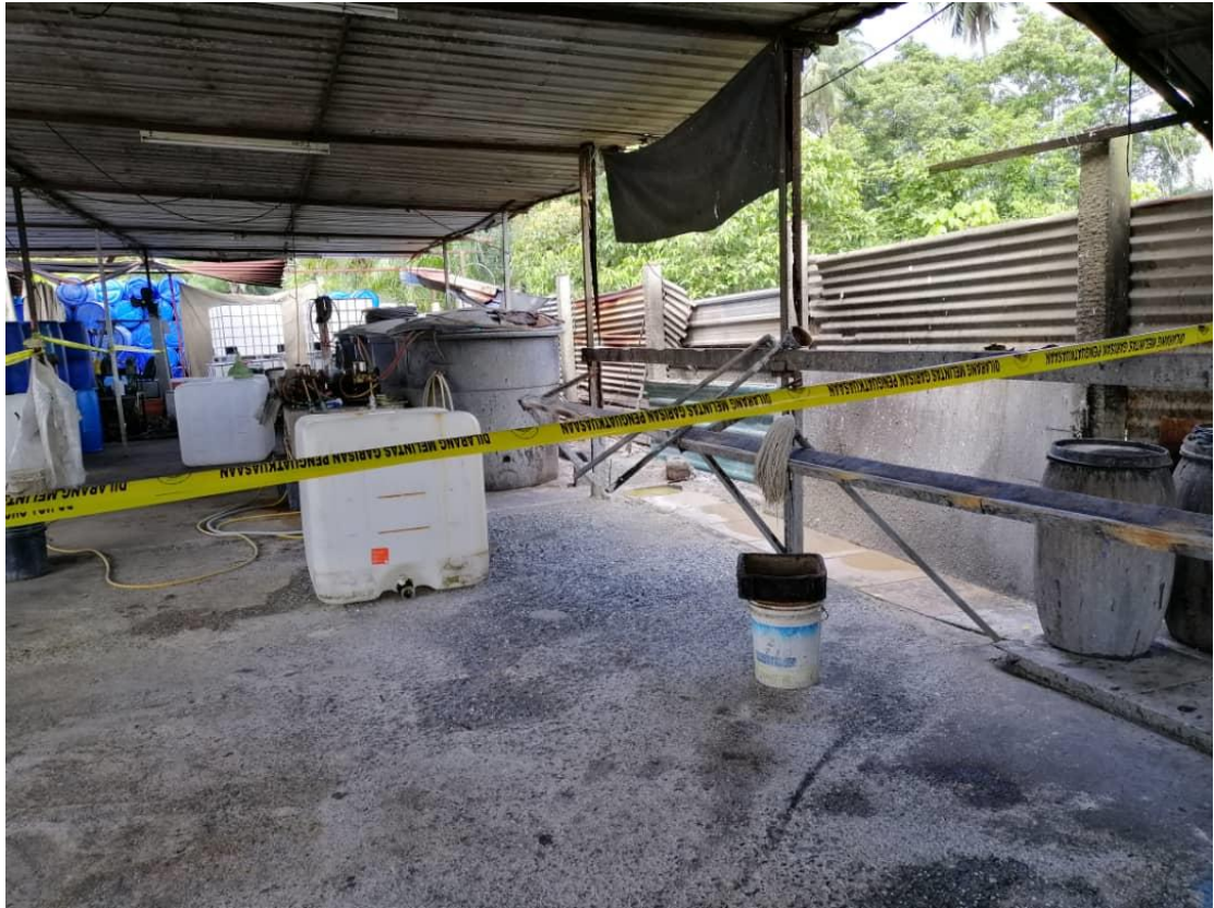
Tempat mencuci tong-tong terpakai telah dikordon dengan pita JAS