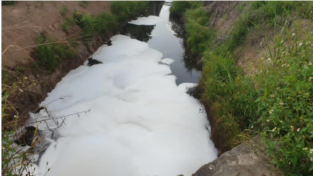
Parit di kawasan Taman Ubudiah, Telok Gong yang dicemari buih berwarna putih

Gambar-gambar semasa siasatan dijalankan