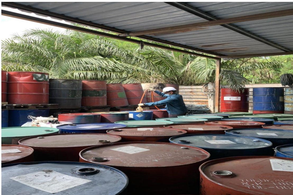
Pegawai JAS sedang mengambil sampel buangan yang terdapat dalam salah sebuah tong drum