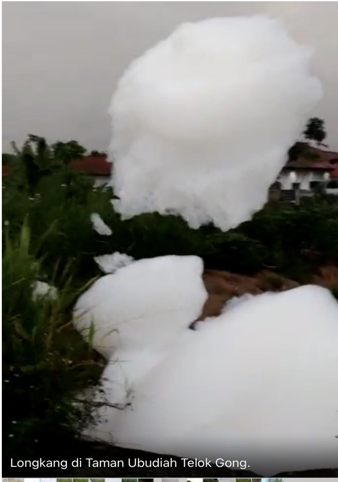
Longkang di Taman Ubudiah Telok Gong.

Gambar buih berwarna putih yang diadukan oleh penduduk Taman Ubudiah, Telok Gong