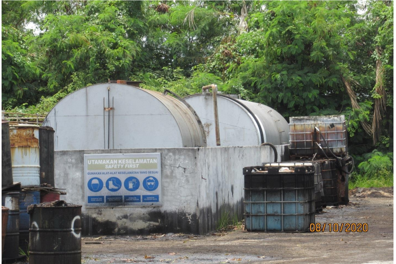
Tangki simpanan minyak yang disyaki mengandungi minyak diesel