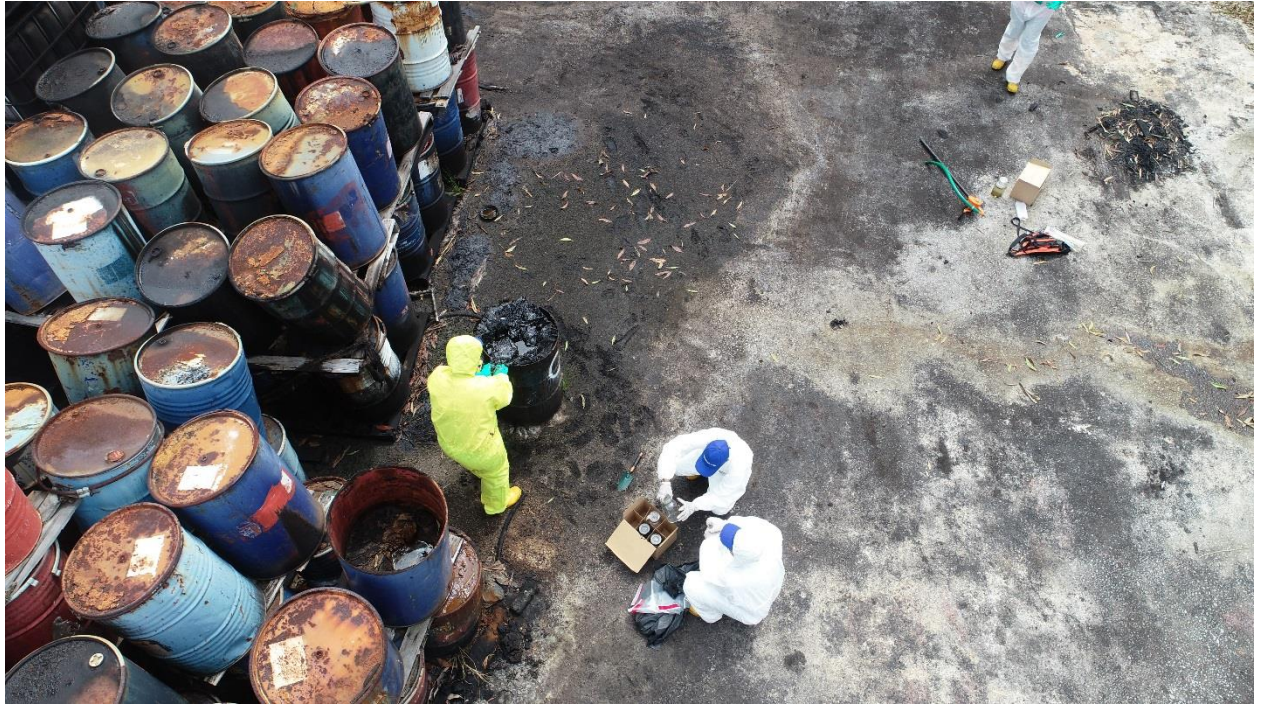
Pegawai JAS menjalankan percontohan buangan terjadual