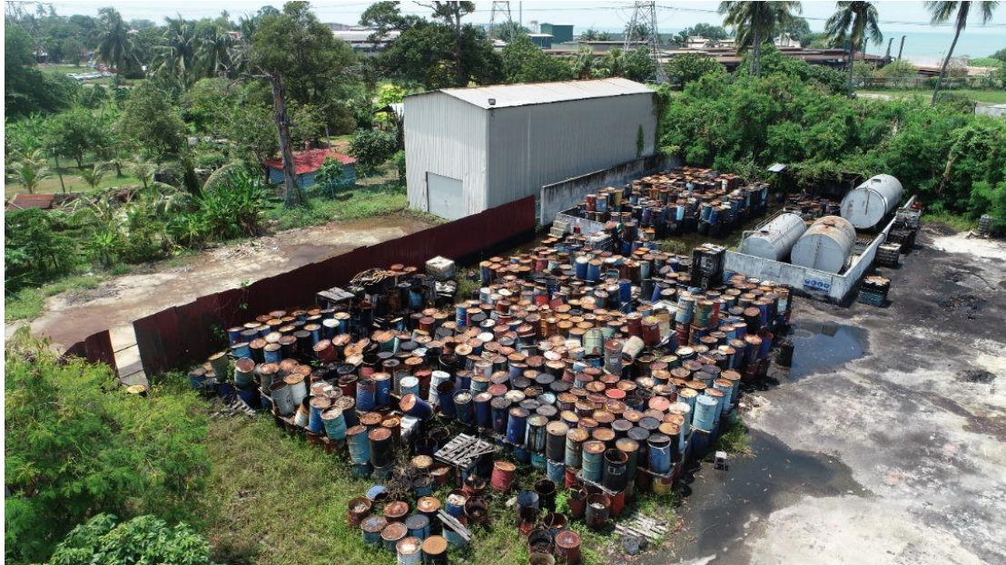
Gambar keseluruhan kawasan gudang penyimpanan

Gambar-gambar di lokasi penyimpanan haram buangan toksik