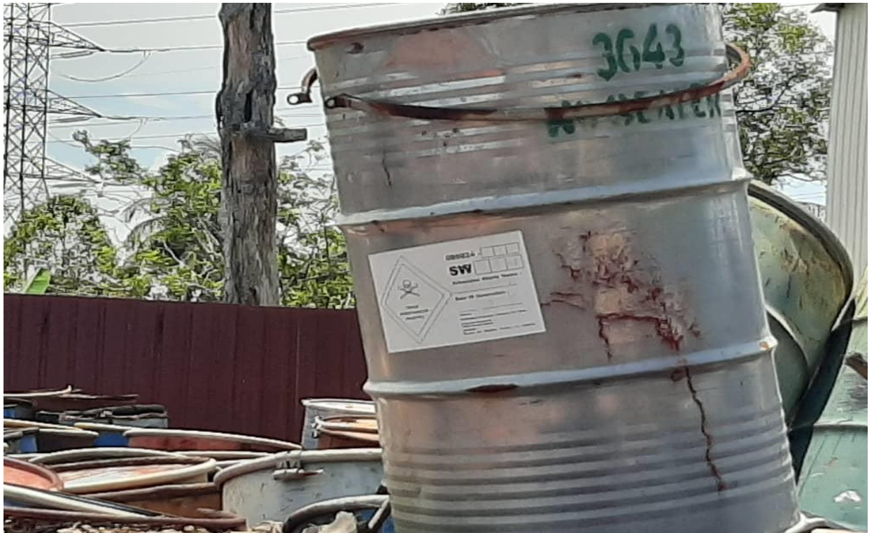
Tong dram yang berlabel buangan terjadual