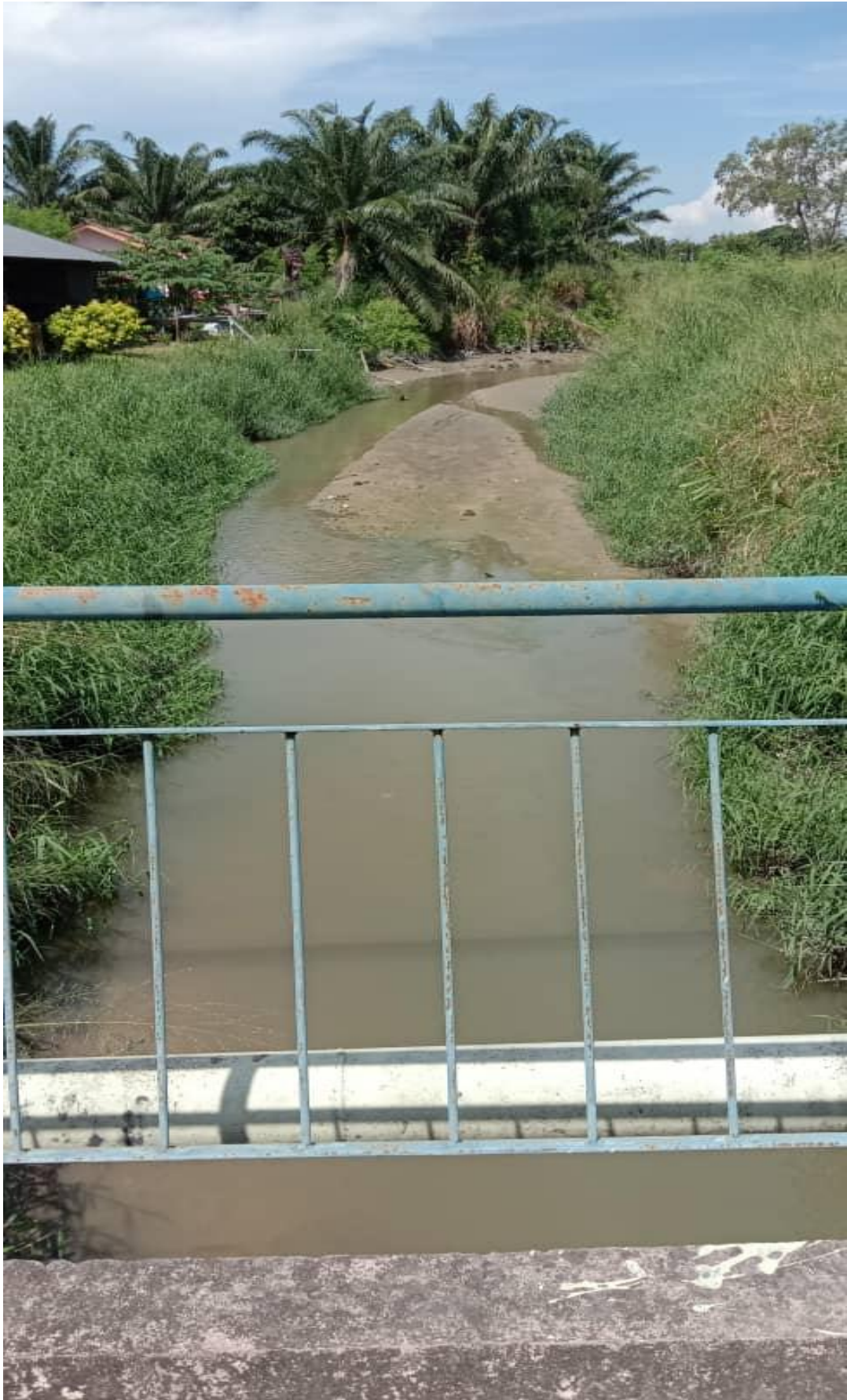
KEADAAN SUNGAI SULOH BATU PAHAT TELAH KEMBALI PULIH. GAMBAR DIAMBIL PADA 30 MEI 2020.