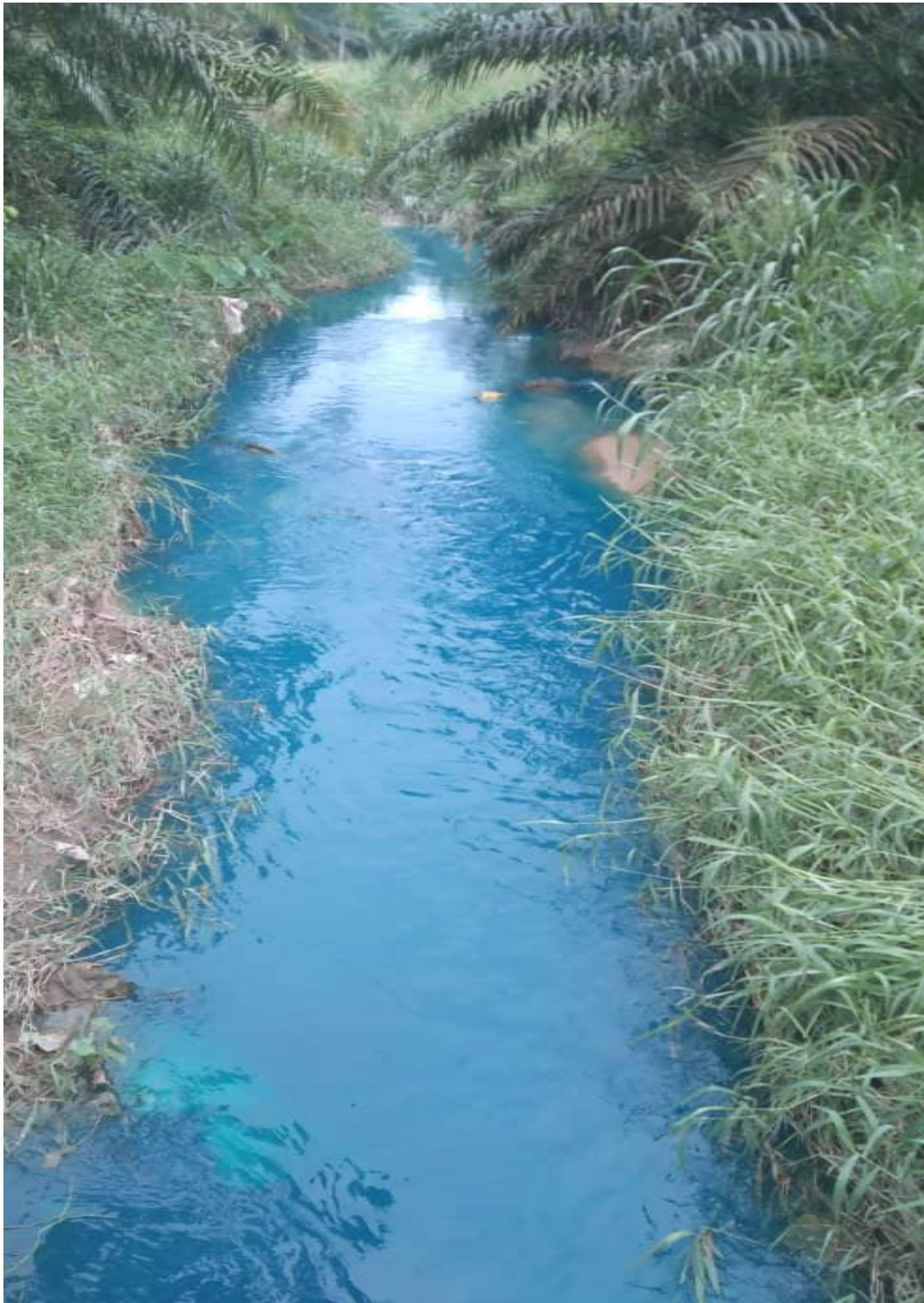
KEADAAN SUNGAI BERWARNA BIRU